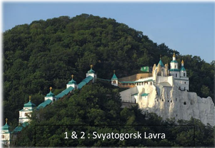
1 & 2 : Svyatogorsk Lavra