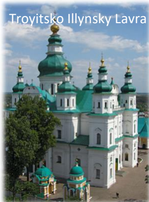
Troyitsko Illynsky Lavra

« Sous l'abri de ta miséricorde, nous nous réfugions, Sainte Mère de Dieu. Ne méprise pas nos prières quand nous sommes dans l'épreuve, mais de tous les dangers délivre-nous toujours, Vierge glorieuse, Vierge bienheureuse ».